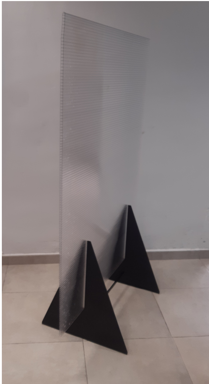
MODELO PTR 10