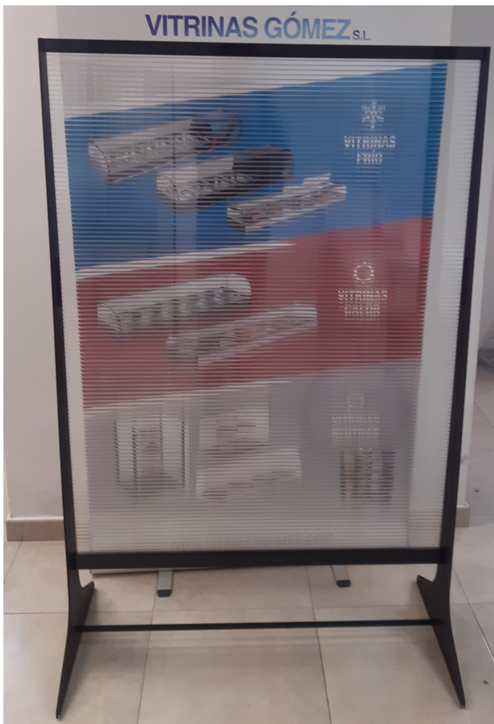
MODELO BPC 100